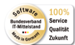
Gütesiegel „Software Made in Germany“