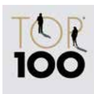
TOP 100 Unternehmen

Weitere zahlreiche Auszeichnungen beweisen die kontinuierliche Qualität von PLANAT. Die ERP/PPS-Lösung FEPA gehört zu den TOP-Software-Lösungen der IT-Bestenliste.