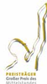
Großer Preis des Mittelstandes